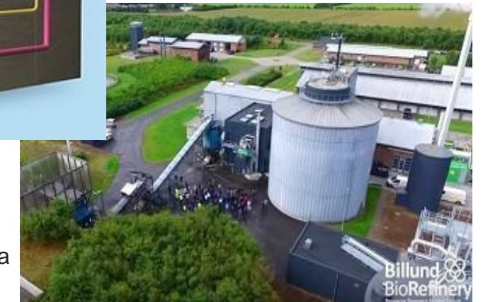
Billund BioRefinery – biogas fra slam mm.