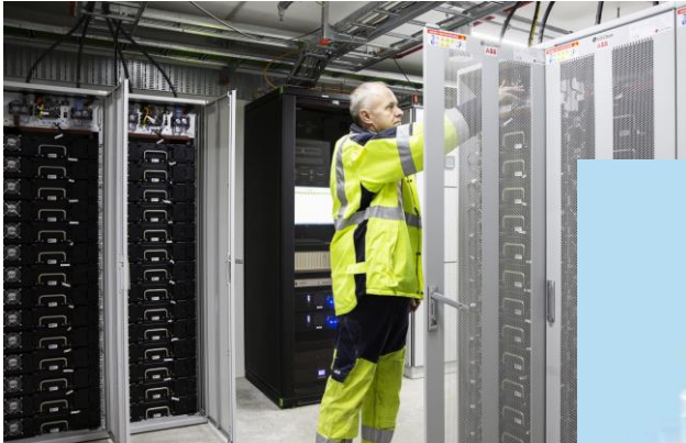
EnergyLab Nordhavn og batterier i elnettet